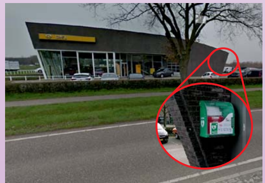
Boven: overzicht- en detailfoto AED bij Opel Jetten, onder overzicht- en detailfoto op Stroomrug 1

Helaas kunnen wij tot nader order geen reanimatietrainingen verzorgen in verband met de coronacrisis. Zodra onze trainer het weer verantwoord vindt zullen we weer starten. Via onze website en facebook houden wij u op de hoogte van eventuele ontwikkelingen hieromtrent.